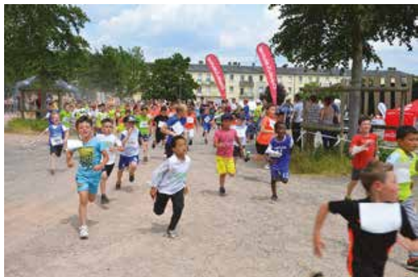
Le bel Effort des Petits