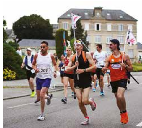
La Bonne Humeur dans la course