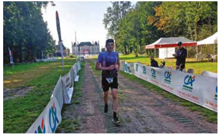
Champions et cadre somptueux Haras du Pin