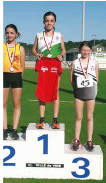
Championne de Normandie Benjamine du 1000m