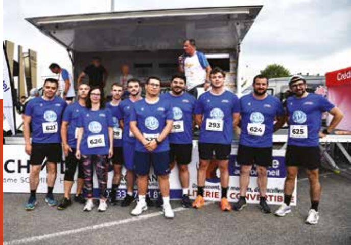
GUIBOUT Matériaux La grosse Equipe