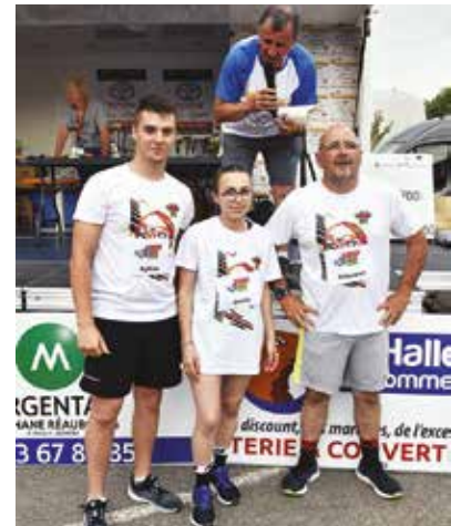
MIMI93 le team DELIS (partenaires dans la course)