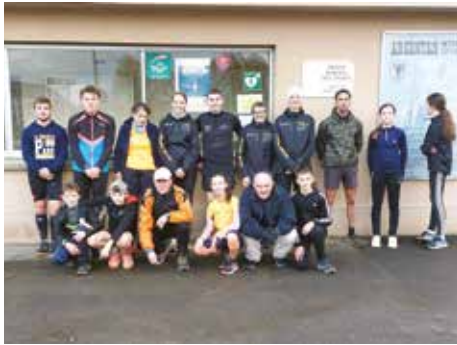
Vacances actives à la Bayard