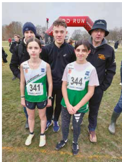
Coach et athlètes au Cross de Jumièges