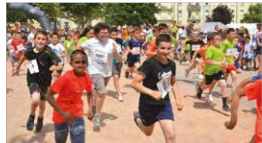
Folle énergie des Scolaires

Les 10 kilomètres d'Argentan veulent offrir à tous la possibilité d'« essayer » la course à pied, et cette notion bien spéciale d'effort de durée. Et pour ce le 7 juin il y aura bien une place toute privilégiée pour les jeunes, venant des clubs et Écoles d'Athlétisme de la région, mais aussi les coureurs en herbe, venant pour nombre d'autres sports, qui, ce soir-là chausseront les baskets, encouragés par leurs familles, leurs copains, avec le but « très olympique » de participer, et de terminer le parcours proposé.