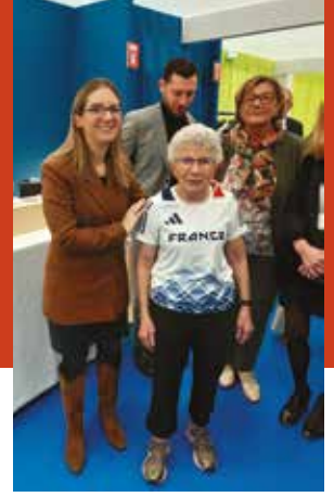
Avec Mme La Ministre