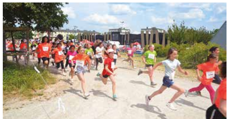
Pour 757 enfants sur le Champ de foire

Ils étaient 757 enfants en 2023, un record de participation, pour une confrontation amicale des Écoles d'Argentan et Interco, vent de jeunesse et grosse ambiance sur le Champ de Foire, pour exprimer leur bonne santé, mais aussi porter fièrement les couleurs de leur établissement, les enfants s'élanceront pour quelques mini boucles sur le champ de foire, entre copains.