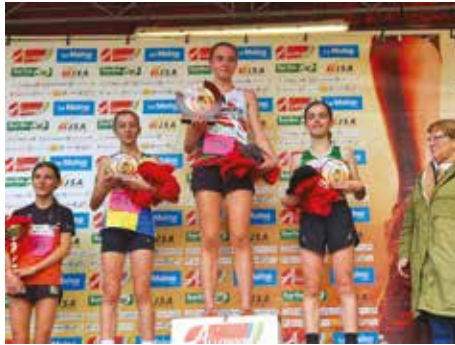
Super podium au cross International d'Allonnes