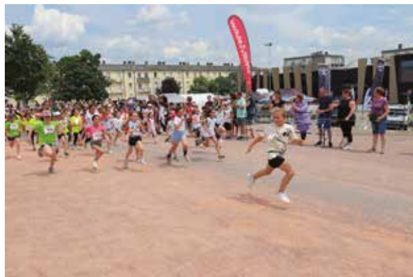
Les Scolaires lance la journée sportive