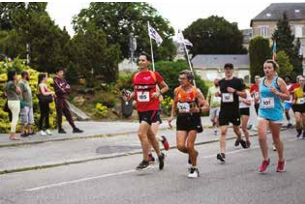
Adjoint aux Sports et Président Bayard meneurs d'Allure

GUIBOUT MATÉRIAUX 61 FLERS - Tél. 02 33 62 40 40 www.ambiancek.fr