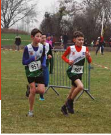
Allez les jeunes