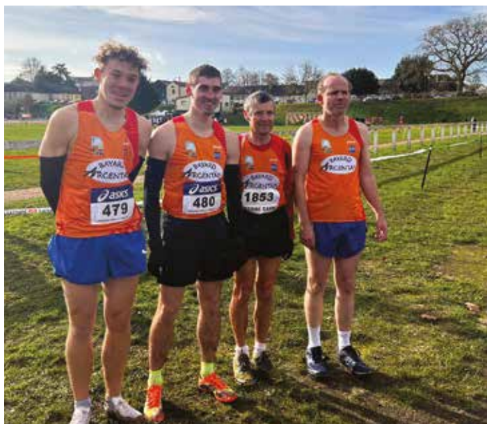
La bayard Club formateur en Cross