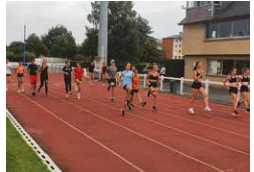
On répète les gammes d'Athlétisme

Chaque mercredi / Chaude ambiance sur le Stade qui reçoit entre 80 et 90 jeunes Et pour les accueillir la BAYARD déploie, met à disposition, 2 fois 4 encadrants :