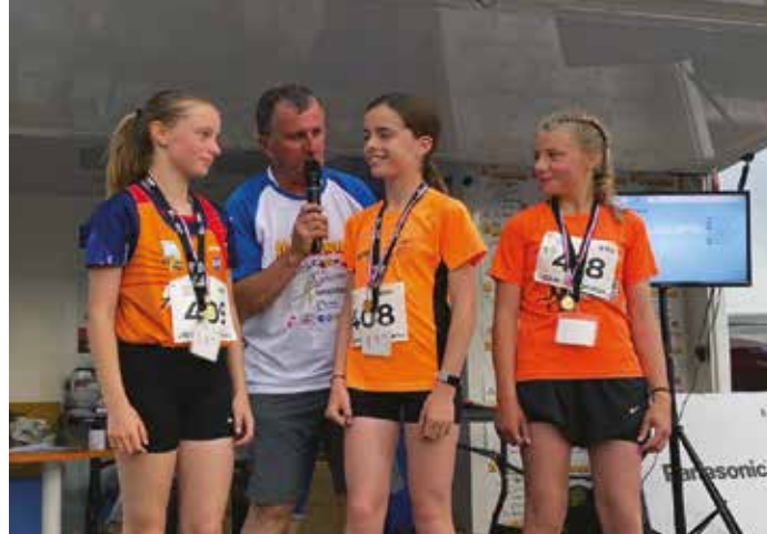
Brillantes devant les Argentanais, aux 10 km d'Argentan