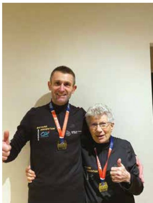
Champions 2 fois à Lyon

Rendez-vous au petit matin du dimanche 14 avril 2024 // Haras du Pin (1er départ à 8h30 )