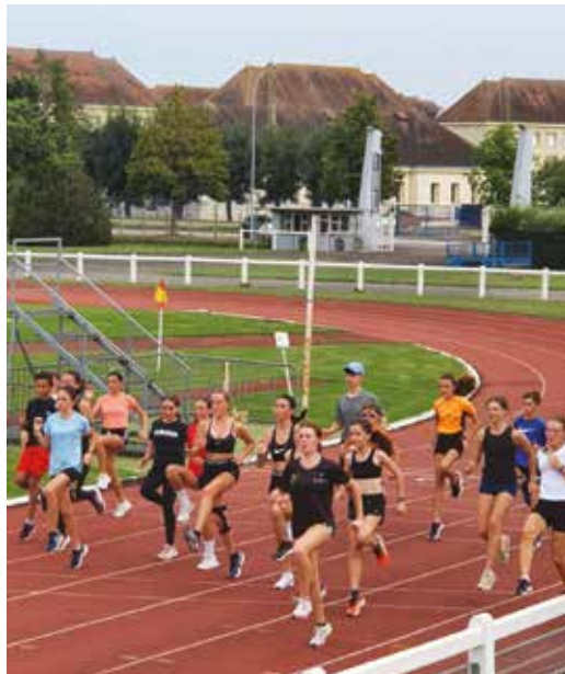
Ambiance et Partage à l'entraînement le vendredi